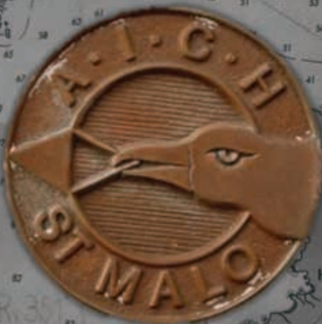
St. Malo, France 1937