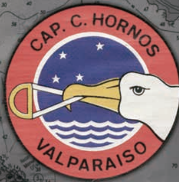
Valparaíso, Chile 1987